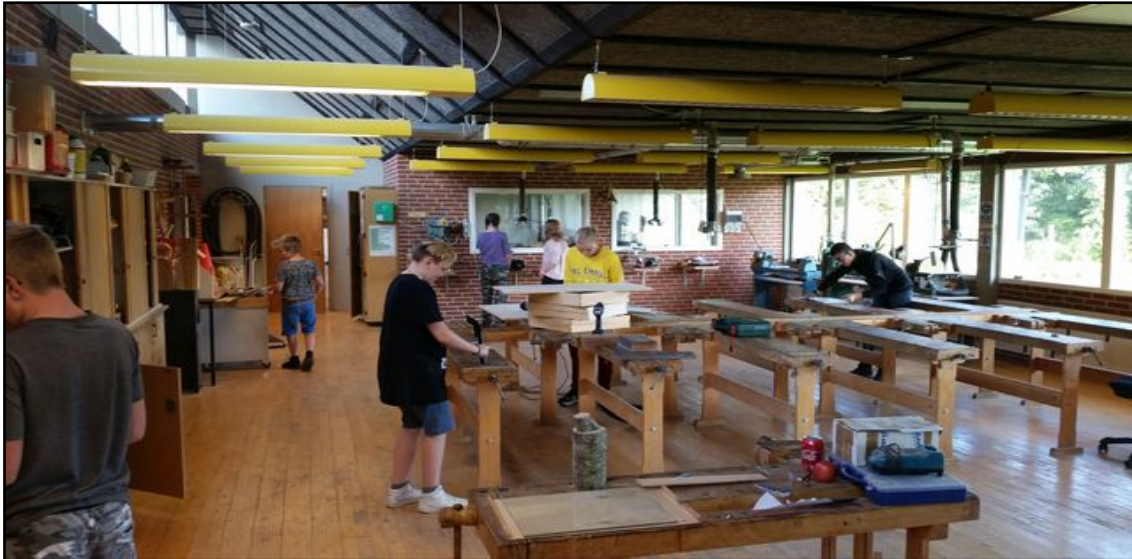
Valghold i sløjdlokalet

Herved forstås personer/virksomheder bosiddende/beliggende i Spjald og omegn. I den åbne skole skal eleverne møde virkeligheden uden for skolen. Skolen skal ud i samfundet, og samfundet skal ind i skolen, så eleverne oplever en sammenhæng og mening, der bidrager til, at de bliver så dygtige, de kan og trives. Børn, der udvikler sig og trives, vil altid være et aktiv for lokalsamfundet nu og i fremtiden. Det er i både skolens og det omkringliggende samfunds interesse at have et konstruktivt samarbejde. Det er naturligt, at lokalsamfundet er en aktiv medspiller omkring børnenes opvækst, ved at gå positivt ind i et samarbejde med skolen og understøtte og styrke de muligheder som lokalsamfundet rummer. I lokalsamfundet har alle et ansvar for hinanden og i særdeleshed for børn og unge.