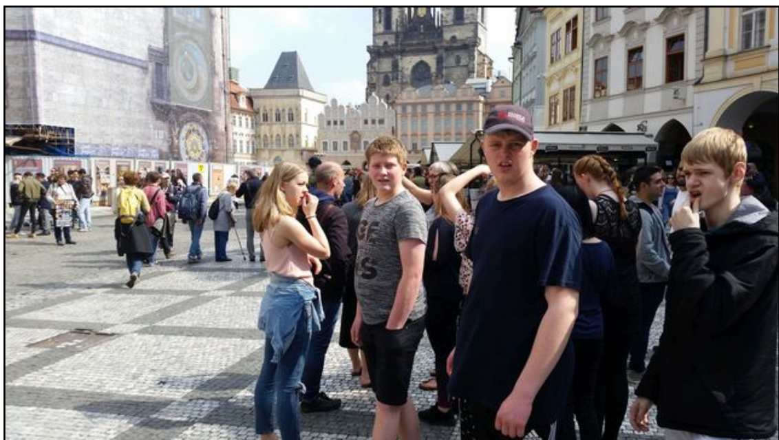
De ældste elever i Prag